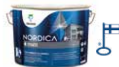
Matt elegans: NORDICA MATT