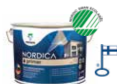
Förbättrad vidhäftning: NORDICA PRIMER