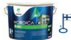
Unik och blank: NORDICA EKO