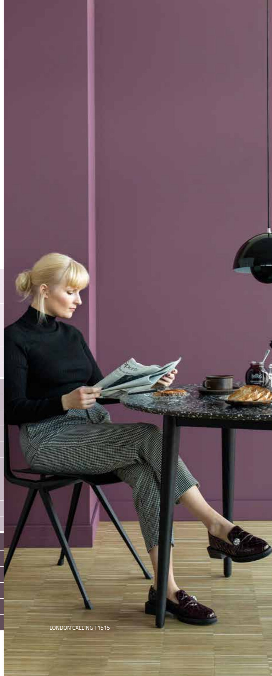
LONDON CALLING T1515