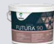
Blank FUTURA AQUA 90