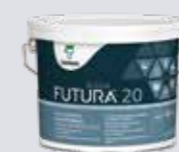
Halvmatt FUTURA AQUA 20