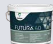
Halvblank FUTURA AQUA 40